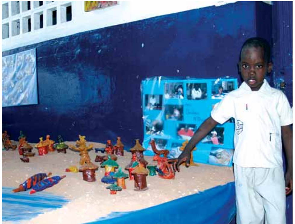
Leurs œuvres sont des "porte-voix". Ils dessinent avec leurs pincesaux, leur colère contre un monde injuste et décrivent leur environnement et leur désir de retrouver une famille.